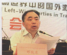
中国社科院马研院长、 党委书记 邓纯东