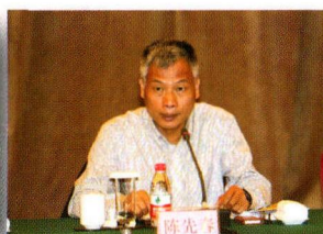
浙江省社会科学界联合会 党组成员、副主席 陈先春