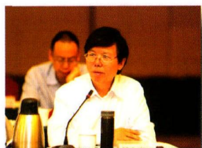
中共中央编译局原秘书长、 研究员 杨金海