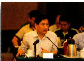
国家行政学院科研部原主任、 一级教授 许耀桐